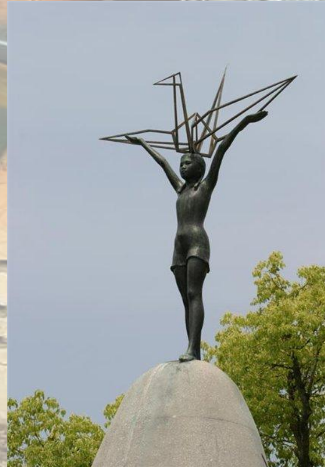
Памятник Садако Сасаки

Трудно найти человека, который не знает песню "Журавли": "Мне кажется порою, что солдаты..." Если вы попросите кого-нибудь вспомнить любую песню о войне, то большинство сразу назовёт "День Победы", но сразу следом за ним - "Журавлей". При этом, немногие знают историю этой песни, искренне полагая, что она была написана в годы Второй Мировой. Но нет, родилась песня "Журавли" позже, гораздо позже - более чем через 20 лет после окончания войны и посвящена событиям в Хиросиме, а конкретно – японской девочке, страдающей от лучевой болезни. Позже текст песни был изменен.