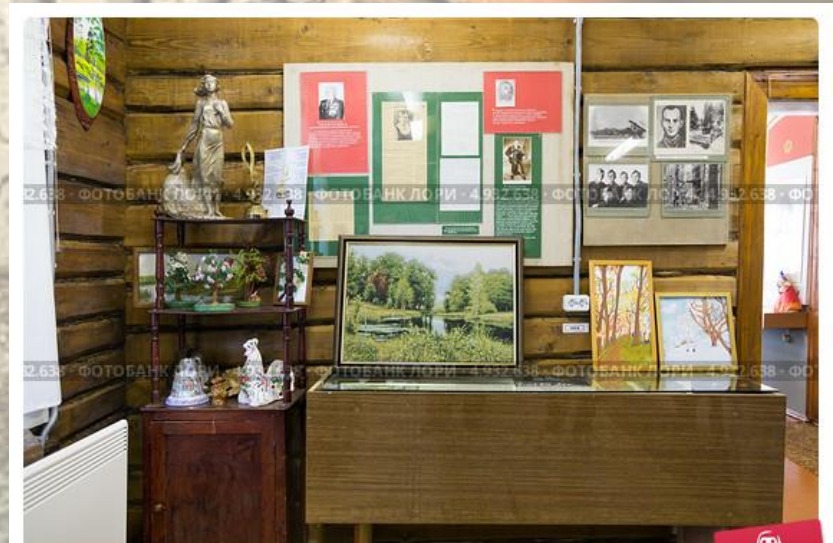
Мемориальный музей М.В. Исаковского (музей песни "Катюша")